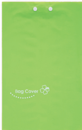
PE バッグカバー たてタイプ