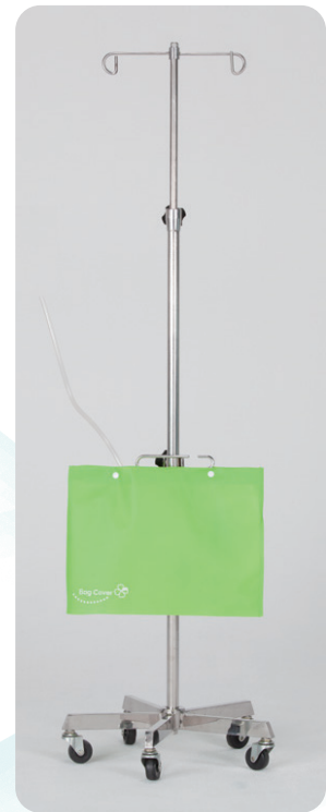
取り付けイメージ

材質：《PE バッグカバー》ポリエチレン、ボタン部分：ABS樹脂 《不織布バッグカバー》不織布、ボタン部分：ABS樹脂 サイズ：《PE バッグカバー》たてタイプ：横250mm×縦400mm よこタイプ：横400mm×縦300mm 《不織布バッグカバー》横400mm×縦300mm