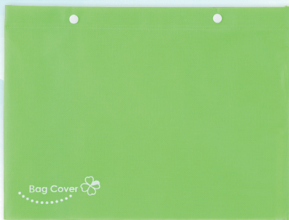
不織布バッグカバー