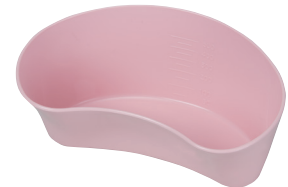
ガーグル・ベース®

材 質：ポリプロピレン 容 量：500ml(目盛50ml刻み) 色：ピンク 重 量：80g サ イ ズ：横180mm×縦105mm×深さ75mm 耐熱温度：140℃