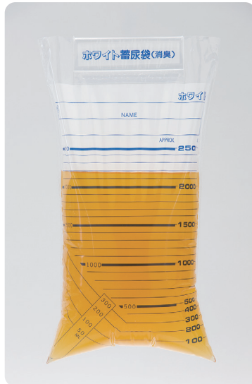
消臭・ホワイト蓄尿袋