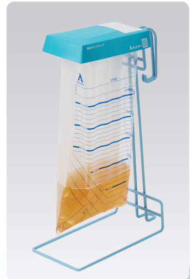
蓄尿スタンド使用例

片面を白く印刷することで、背景や隣り合った尿の色に影響されず 正確な量、色観察を可能にした消臭・ホワイト蓄尿袋と、 患者様のプライバシー保護に配慮した蓄尿袋(プライバシー保護)の 2種類をご用意しています。