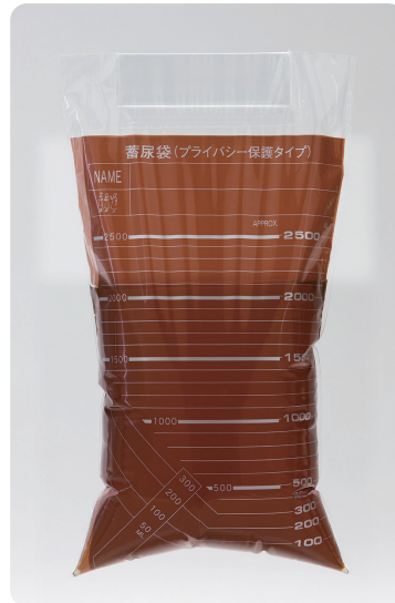
蓄尿袋(プライバシー保護タイプ)